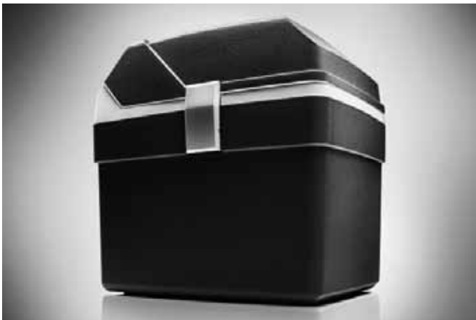
Kühl-/Warmhaltebox, elektrisch. Portabel, 18 Liter Volumen.