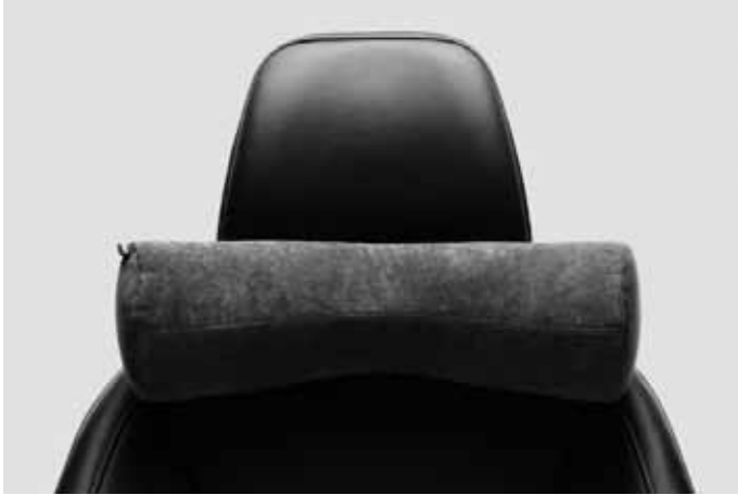
Komfortkissen. Weich gepolstertes Nackenkissen zur Befestigung an jeder Kopfstütze. Bezug abnehmbar und waschbar.