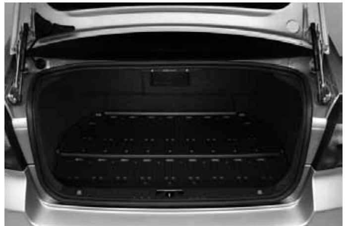
Gepäckraum-Schalenmatte. Mittig klappbar, für Zugang zum Gepäckraumboden.