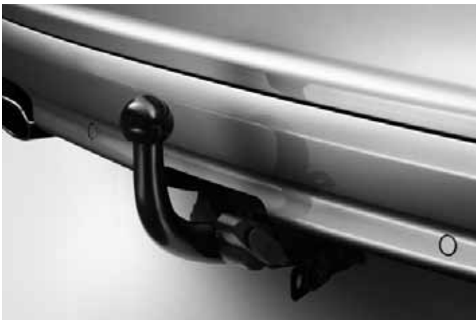
Anhängerkupplung, fest oder abnehmbar.