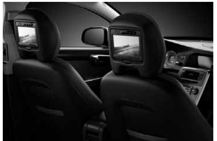
Rear Seat Entertainment (RSE).

Weiteres Zubehör sowie die aktuellen unverbindlichen Preisempfehlungen der Volvo Car Germany GmbH entnehmen Sie bitte den Zubehörlisten auf www.volvocars.de