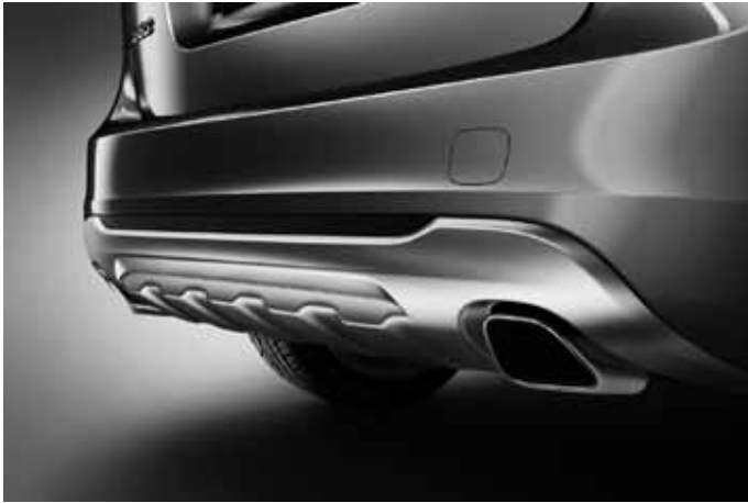
Heckschürzeneinsatz, Aluminium-Optik und Sport-Endrohre, Edelstahl poliert. Für Motorisierung D3 ein Endrohr, für alle anderen Motorisierungen zwei Endrohre.

Die Zubehörteile Frontspoilereinsatz, Dekorrahmen, Schwellerleisten und Heckschürzeneinsatz sind auch erhältlich als komplettes Designpaket mit Preisvorteil.