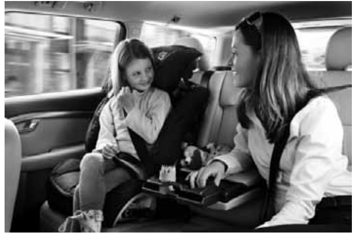
Gurtkissen mit Rückenlehne.

Die Zubehörteile Frontspoilereinsatz, Dekorrahmen, Schwellerleisten und Heckschürzeneinsatz sind auch erhältlich als komplettes Designpaket mit Preisvorteil.