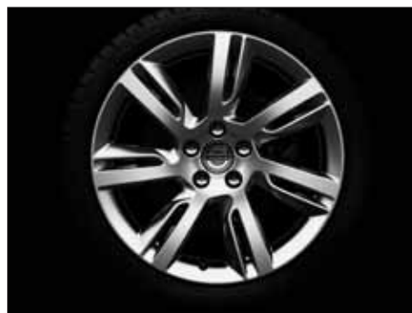
Sleipner 8,0 x 18"