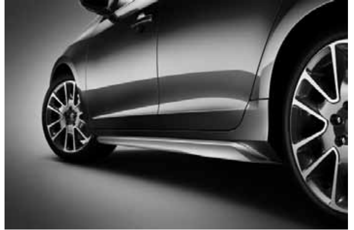
Schwellerleisten (Paar), Aluminium-Optik.