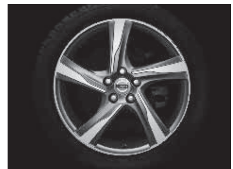
Ixion 8,0 x 18"