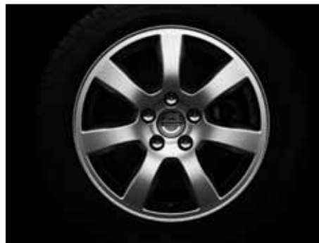
Oden 7,0 x 16"