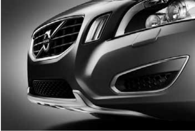
Frontspoilereinsatz und Dekorrahmen vorn (Paar), Aluminium-Optik.