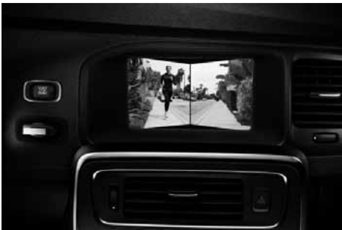
Frontkamera. Nur in Verbindung mit Audiopaket High Performance Multimedia oder Audiopaket Premium Sound Multimedia.

Gruppe III, für Kinder von ca. 15 bis 36 kg Körpergewicht. Erfüllt die Normen ECE R44-04 und Öko-Tex Standard 100.