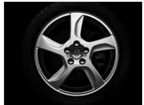
Balder 7,0 x 17"