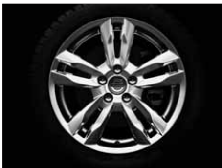
Njord 8,0 x 17"