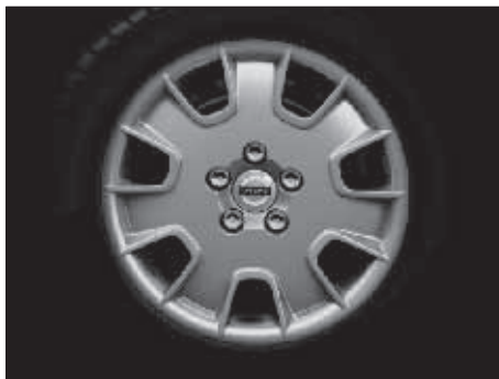
Stahlfelge 7,0 x 16"