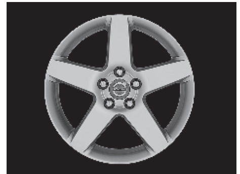
Serapis 7,5 x 17"