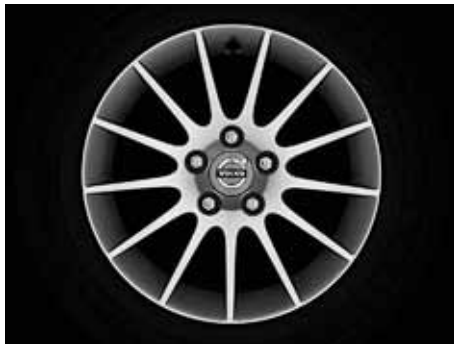
Castula 7,5 x 16"