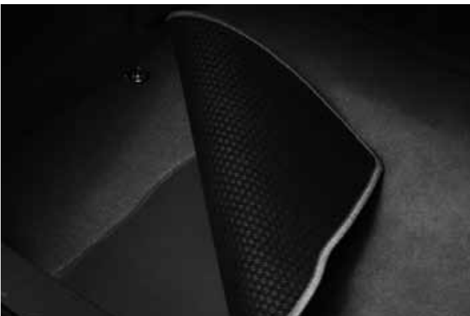
Gepäckraummatte. Nur in Verbindung mit dem Organizer Reserveradmulde.