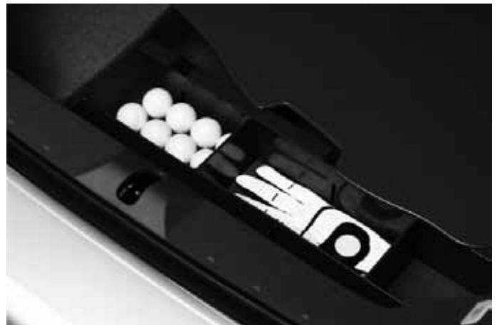
Organizer Reserveradmulde. Verstellbare Fächer zur Aufbewahrung kleiner Gegenstände.