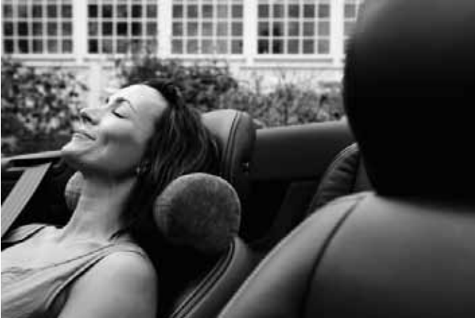
Komfortkissen. Weich gepolstertes Nackenkissen zur Befestigung an jeder Kopfstütze. Bezug abnehmbar und waschbar.