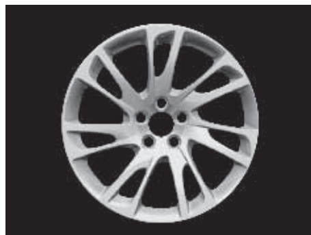
Morpheus 8,0 x 18"