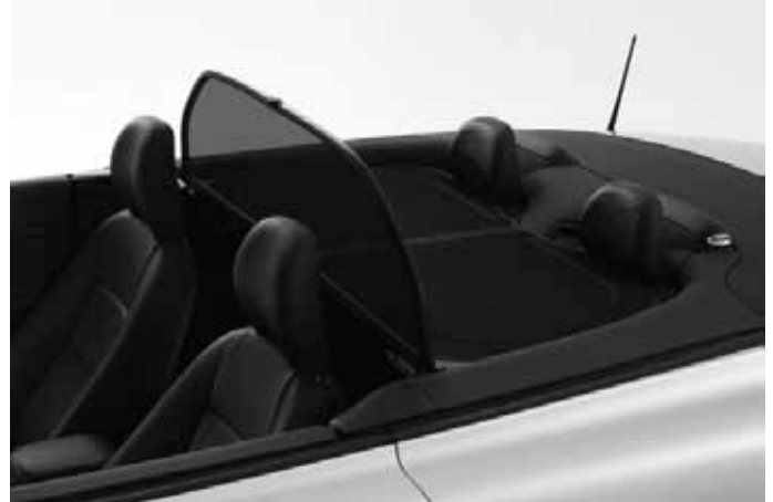
Windschott. Traditionelles Windschott, klappbar und faltbar. Horizontale Flächen mit Reißverschlüssen, für einfachen Zugang zur Rücksitzbank.