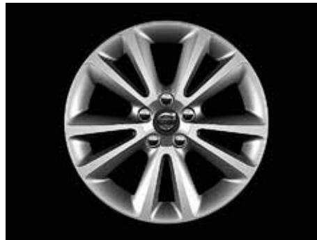
Sirona 7,5 x 17"