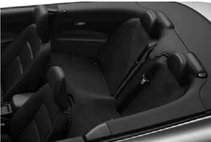
Schutzbezug Rücksitzbank. Vollflächige Abdeckung, mit Durchführungen für die Sicherheitsgurte.