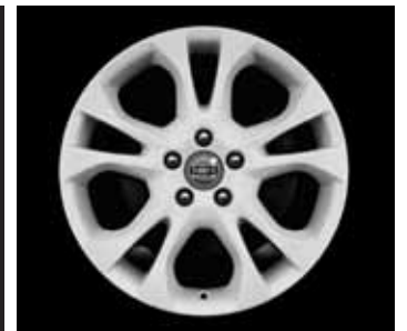
Styx White 7,0 x 17"