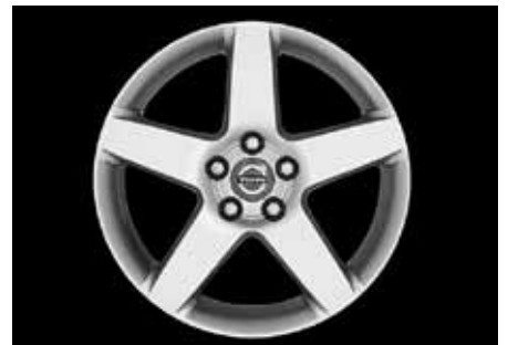
Serapis 7,0 x 17"