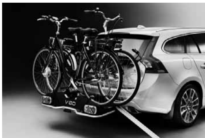
Fahrradträger „E-Bike“ und Laderampe, für Anhängerkupplung. Für bis zu zwei Elektrofahrräder.