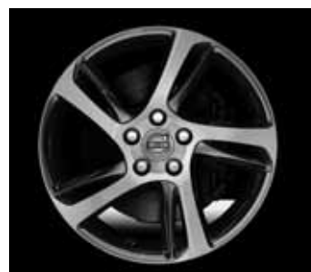
Spider 7,0 x 17"