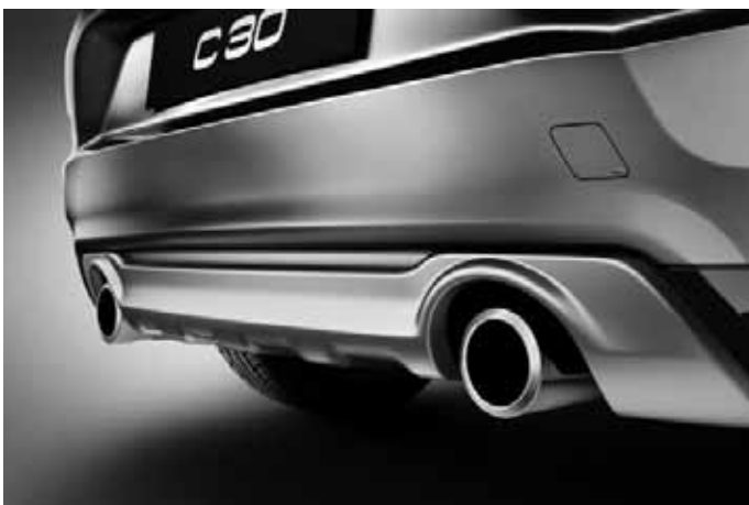
Heckschürzeneinsatz, Aluminium-Optik und Sport-Endrohre (Paar), Edelstahl poliert. Sport-Endrohre nur für Motorisierungen D3, D4 und T5. Nicht in Verbindung mit R-Design. Nicht in Verbindung mit DRiVe Start/Stopp.

Die Zubehörteile Frontspoilereinsatz, Dekorrahmen, Schwellerleisten und Heckschürzeneinsatz sind auch erhältlich als komplettes Designpaket mit Preisvorteil.