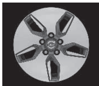
Libra 6,5 x 16"