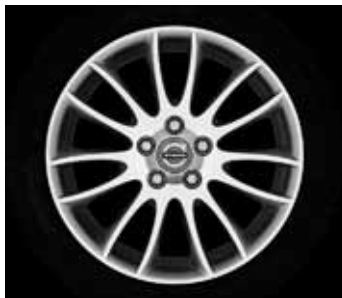
Spartacus 7,0 x 17"

2) Nicht in Verbindung mit Sportfahrwerk.