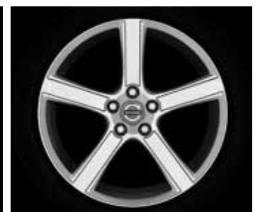
Midir 7,5 x 18"