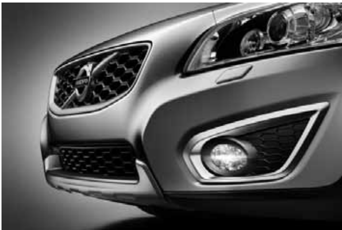
Frontspoilereinsatz und Dekorrahmen vorn (Paar), Aluminium-Optik. Nicht in Verbindung mit R-Design.