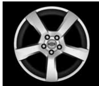
Cratus 7,0 x 17"