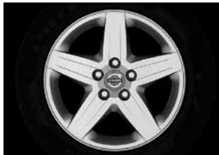
Ceryx 6,5 x 16"