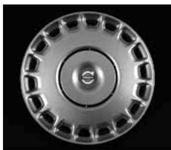
Stahlfelge mit Radzierblende