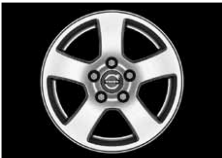
Isis 6,0 x 15"