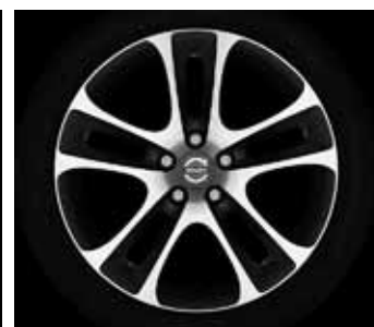
Atreus 7,5 x 18"