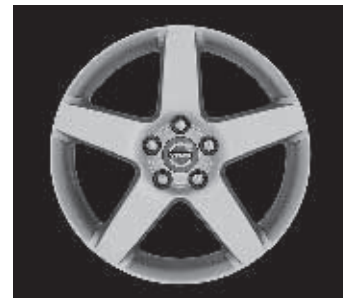
Serapis 7,0 x 17"