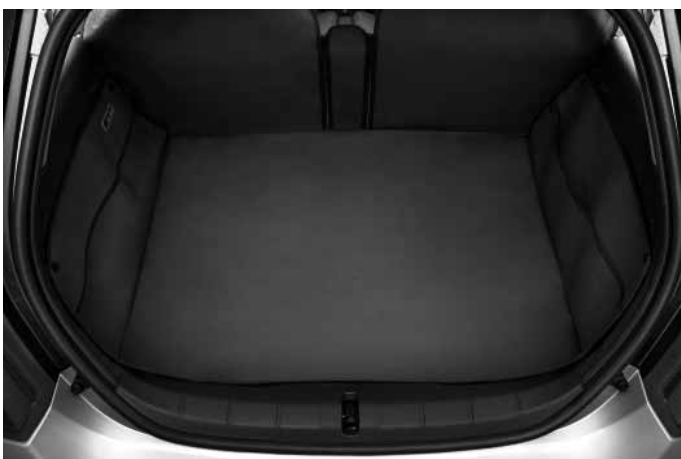
Gepäckraum-Schutzmatte. Vollflächige Abdeckung des Gepäckraumes bis zur Unterkante der Fenster. Integrierte Taschen links und rechts. Robustes und flexibles Vinylmaterial.