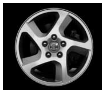
Convector 6,5 x 16"