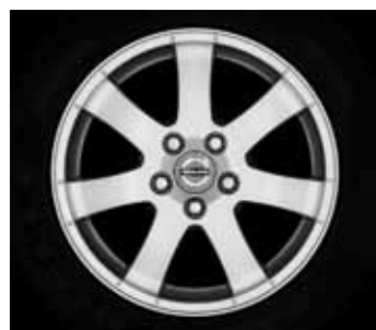
Cordelia 6,5 x 16"