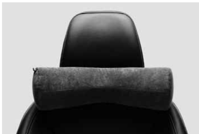
Komfortkissen. Weich gepolstertes Nackenkissen zur Befestigung an jeder Kopfstütze. Bezug abnehmbar und waschbar.

Die Zubehörteile Frontspoilereinsatz, Dekorrahmen, Schwellerleisten und Heckschürzeneinsatz sind auch erhältlich als komplettes Designpaket mit Preisvorteil.