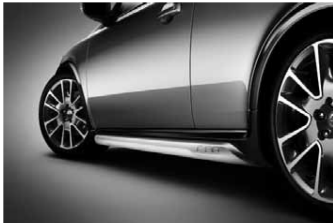
Schwellerleisten (Paar), Aluminium-Optik, mit Schriftzug „C30“. Nicht in Verbindung mit R-Design.