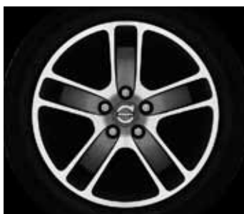
Zaurak Graphit/Silber 7,0 x 17"