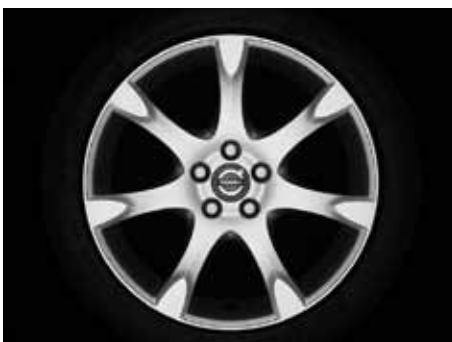
Fortuna 8,0 x 18"