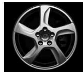
Balder 7,0 x 17"