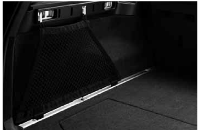
Netztasche und Hakenleisten (Paar). Hakenleisten inklusive sechs Aluminium-Haken. Hakenleisten (Paar), eine Netztasche sowie ein multifunktionaler Gepäckraumteiler sind auch als „Laderaumsystem-Vorteilspaket“ erhältlich.