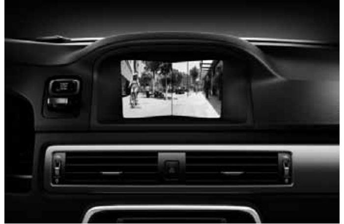
Frontkamera. Nur in Verbindung mit Audiopaket High Performance Multimedia oder Audiopaket Premium Sound Multimedia.