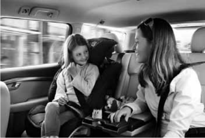
Gurtkissen mit Rückenlehne. Gruppe III, für Kinder von ca. 15 bis 36 kg Körpergewicht. Erfüllt die Normen ECE R44-04 und Öko-Tex Standard 100.