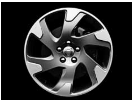
Argus Diamantschnitt/Hellgrau 8,0 x 18"