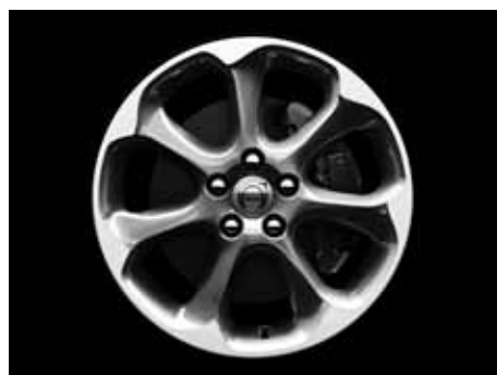
Pontos 7,5 x 17"