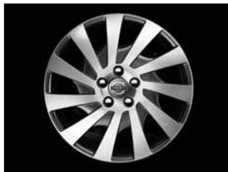
Saga 7,0 x 17"