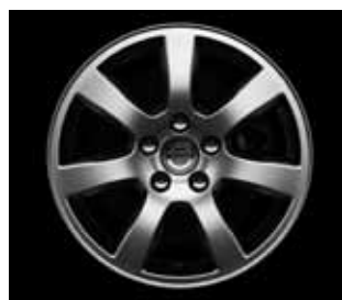
Oden 7,0 x 16"