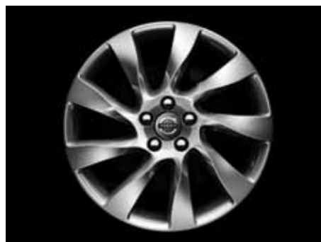
Magni 8,0 x 18"