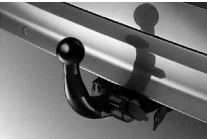
Anhängerkupplung, fest oder abnehmbar.