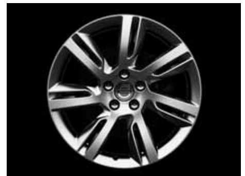
Sleipner 8,0 x 18"