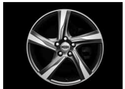
Ixion 8,0 x 18"