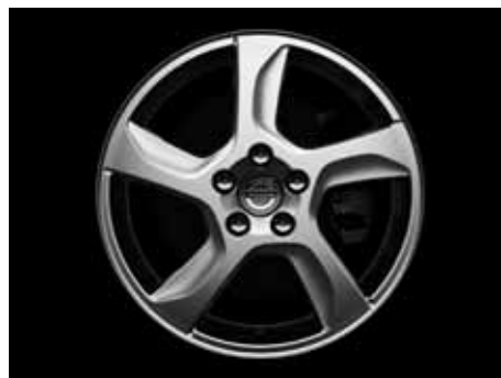
Balder 7,0 x 17"