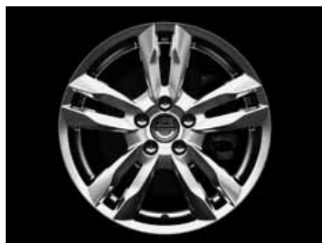
Njord 8,0 x 17"