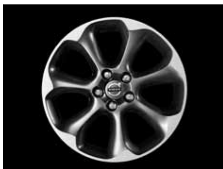
Pontos Diamantschnitt/Hellgrau 7,5 x 17"