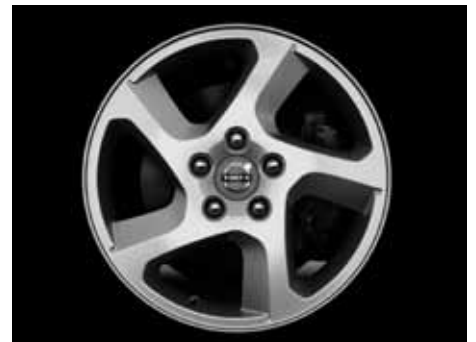
Convector 6,5 x 16"