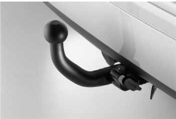
Anhängerkupplung, fest oder abnehmbar.