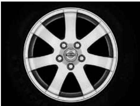
Cordelia 6,5 x 16"