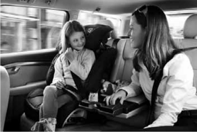
Gurtkissen mit Rückenlehne. Gruppe III, für Kinder von ca. 15 bis 36 kg Körpergewicht. Erfüllt die Normen ECE R44-04 und Öko-Tex Standard 100.