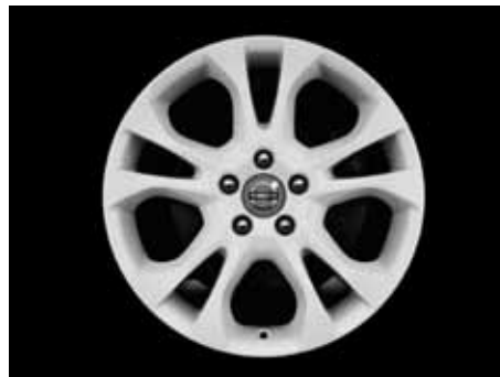
Styx White 7,0 x 17"