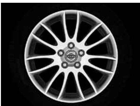
Spartacus 7,0 x 17"