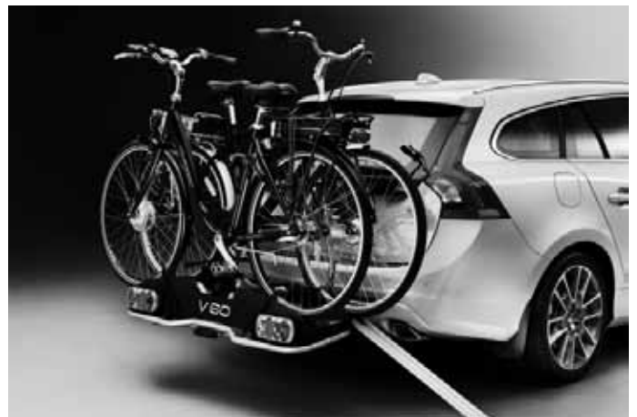
Fahrradträger „E-Bike“ und Laderampe, für Anhängerkupplung. Für bis zu zwei Elektrofahräder.

Weiteres Zubehör sowie die aktuellen unverbindlichen Preisempfehlungen der Volvo Car Germany GmbH entnehmen Sie bitte den Zubehörpreislisten auf www.volvocars.de