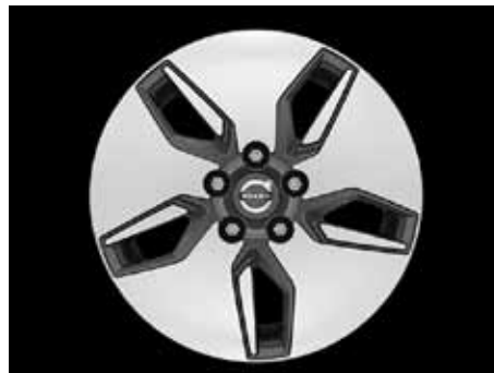
Libra 6,5 x 16"