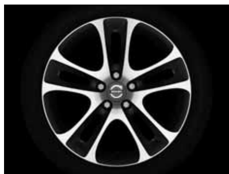
Atreus 7,5 x 18"